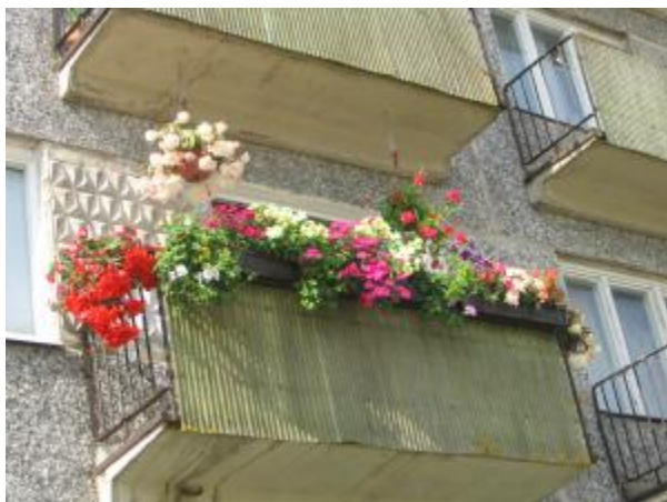
Attēlā - viens no „gaisa dārziem”

Meklējot jaunas pašvaldības un iedzīvotāju dialoga iespējas, sadarbībā ar sabiedriskajām organizācijām gada otrajā pusē tika uzsākta gatavošanās Madonas Iedzīvotāju saietam.