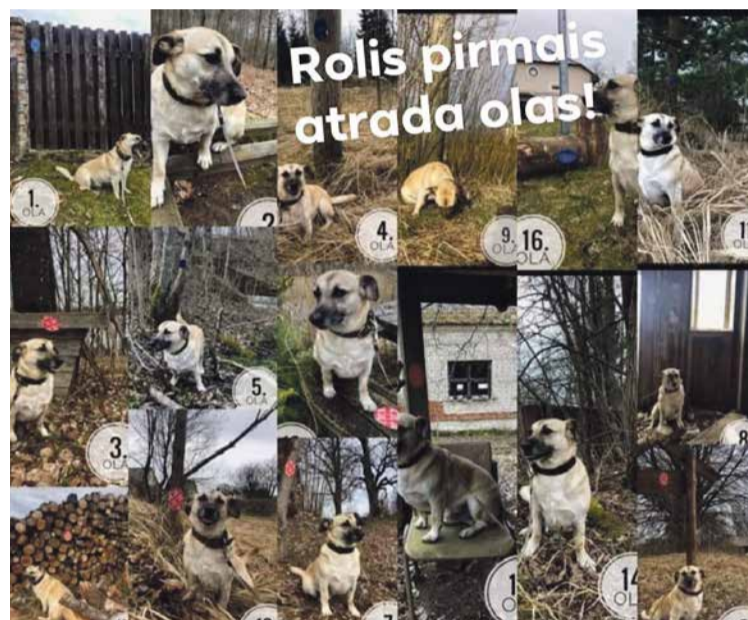
Vestiena. Konkursa foto.