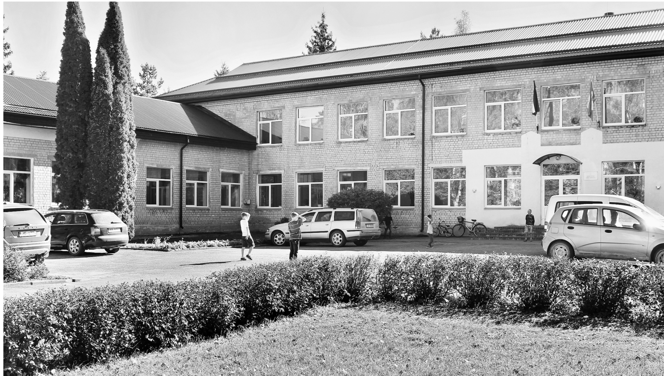
Mārcienas sākumskolas ēka būvēta 1960. gadā kā tā laika kara pilsētiņas sastāvdaļa un darbojās kā krievu plūsmas vidusskola ar aptuveni trim simtiem skolēnu! Par pamatskolu tā tika pārvēdota 1994. gadā, kad no Mārcienas aizbrauca padomju armijas daļa. Skolas mācību telpu platība ir 635 kvadrātmetri. To veido mācību kabineti, nodarbību telpas, bibliotēka, aktu zāle, kā arī no 2015. gada septembra izvietota pirmskolas izglītības grupiņa. 2007.–2008. gadā skolas telpās notika plaši renovācijas darbi. Šobrīd skolā mācās nepilni pieci desmiti audzēkņi.

Novada pašvaldība nodrošina skolēnu nokļūšanu izglītības iestādē ar skolēnu autobusu vai apmaksā sabiedrisko transportu. Ceļa izdevumi tiek apmaksāti arī tiem skolēniem, kas mācās Madonas novada pašvaldības vispārizglītojošajās skolās, bet ir deklarēti citās administratīvajās teritorijās. Madonas novada teritorijā deklarētajiem skolēniem tiek apmaksāti ceļa izdevumi, ja viņi apmeklē profesionā-