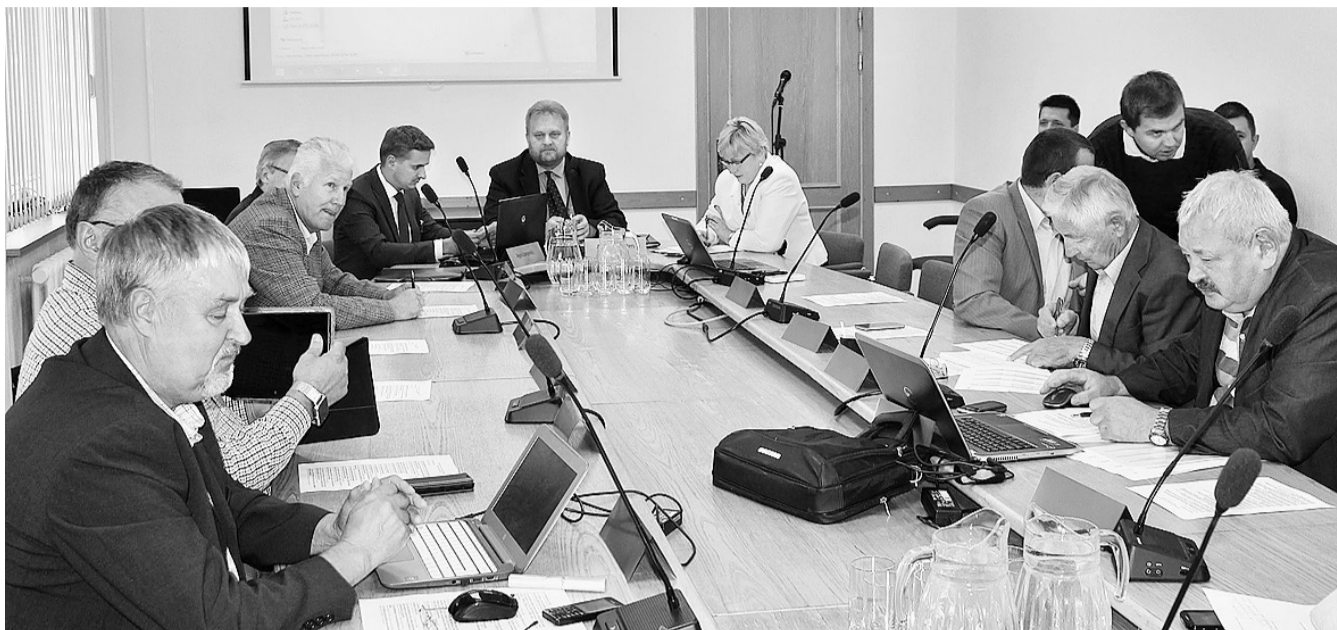
Kā ierasts, domes sēdes notiek katra mēneša pēdējā ceturtdienā, un deputāti uz tām ierodas laikus, lai paspētu vēl precizēt vai noskaidrot kādu darba kārtības jautājumu.

– Nekustamajam īpašumam “Kaimiņi”, kas atrodas “Kaimiņi”, Mētriena, Mētrienas pagasts, Madonas novads, LV 4865, sastāv no zemes gabala, kas aptver 0,2937 ha un pagrabā ēkas ar kadastra Nr. 70760080431; sākcena – 3200 eiro, izsoles solis – 200 eiro.