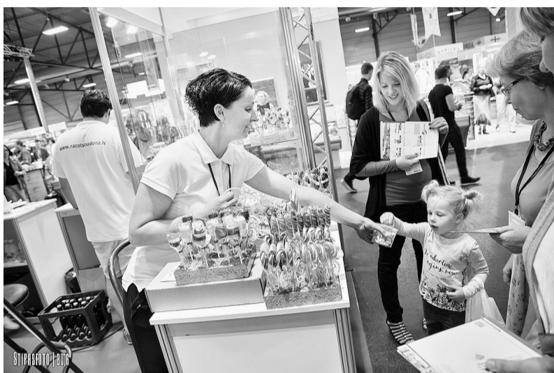
Par “Ražots Madonā” stendu interesējās arī paši mazākie izstādes apmeklētāji.

Mums šķiet, ka katru gadu nevajadzētu tur piedalīties. Kad ir kaut kas jauns un interesants, ko parādīt, tad arī jāiet.” ●