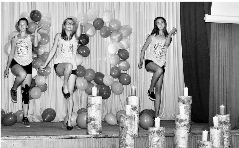
Ļaudonas meitenes ar atraktīvu deju radīja īstu ballītes atmosfēru.