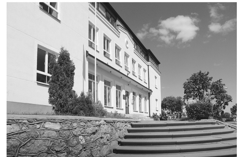
Madonas Valsts ģimnāzija, dibināta 2003. gadā.

Valsts prezidents Raimonds Vējonis svinīgā ceremonijā ir pasniegjis Ata Kronvalda balvu pedagoģiem, Lielās un Mazās pūces balvu visaugstāk novērtētajām skolām Latvijā, kā arī apbalvojis Zvaigžņu reitinga skolas – Rīgas Valsts 1. ģimnāziju, Rīgas 89. vidusskolu, Cēsu Valsts ģimnāziju un Madonas Valsts ģimnāziju. Šis ir jauns Ata Kronvalda fonda izveidots reitings, kurā tiek ņemti vērā skolēnu sasniegumi starptautiskās olimpiādēs gada garumā.