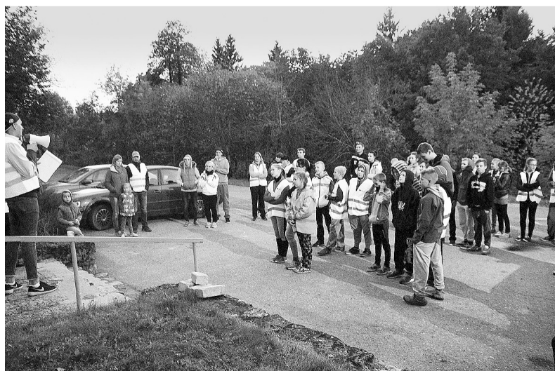
Mirkļis pirms sacensību sākuma.

19.00 pie BJIC "UP's", Vesetas ielā 4, Jaunkalsnavā.