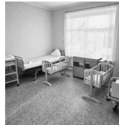
Plašajās un gaišajās palātās izvietotas jaunas mēbeles.

EPIQ5. Kopumā Pētera Avena labdarības fonds Madonas slimnīcai ir uzdāvinājis iekārtas 215 440 eiro vērtībā.