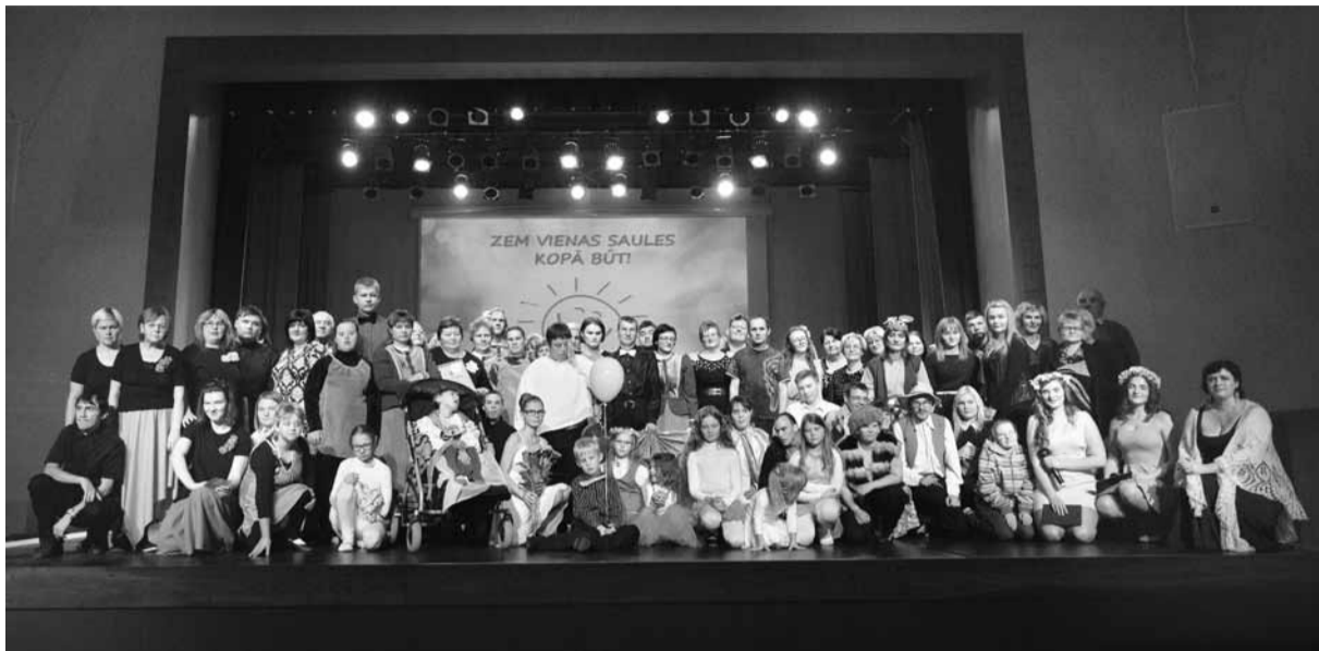
Visi kopā – festivāla dalībnieki no Madonas, Gulbenes, Siguldas, Litenes, Viļāniem un Varakļāniem.