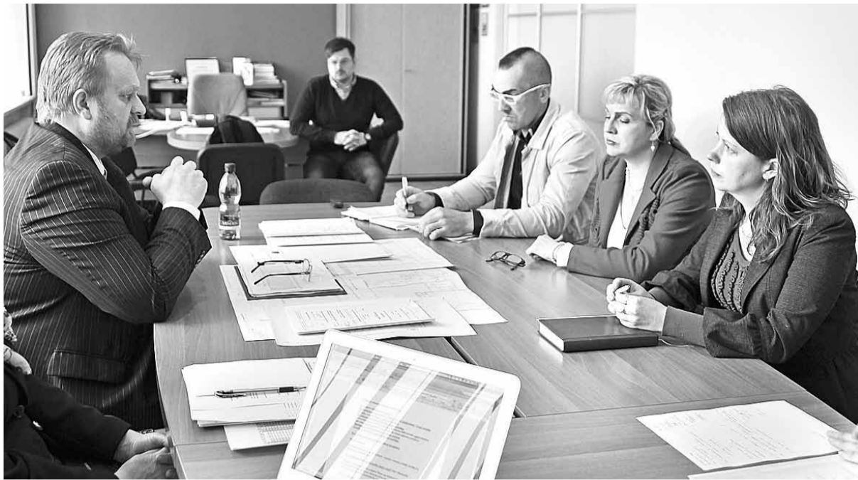
21. maijā triju pārmaiņās iesaistīto skolu padomju vadītāji tikās ar domes priekšsēdētāju Andreju Čelapīteru.

3. izglītības iestāžu, kurās plānots veikt ERAF investīcijas 8.1.2. specifiskā atbalsta mērķa ietvaros, esošās situācijas raksturojums un prognozes uz 2025. gadu sadalījumā pa izglītības pakāpēm 1.–6.