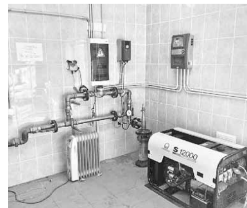
Ūdens attīrīšanas stacija.