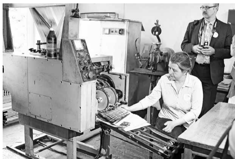
Uz šīs iekārtas tiek drukāts arī "Madonas Novada Vēstnesis".