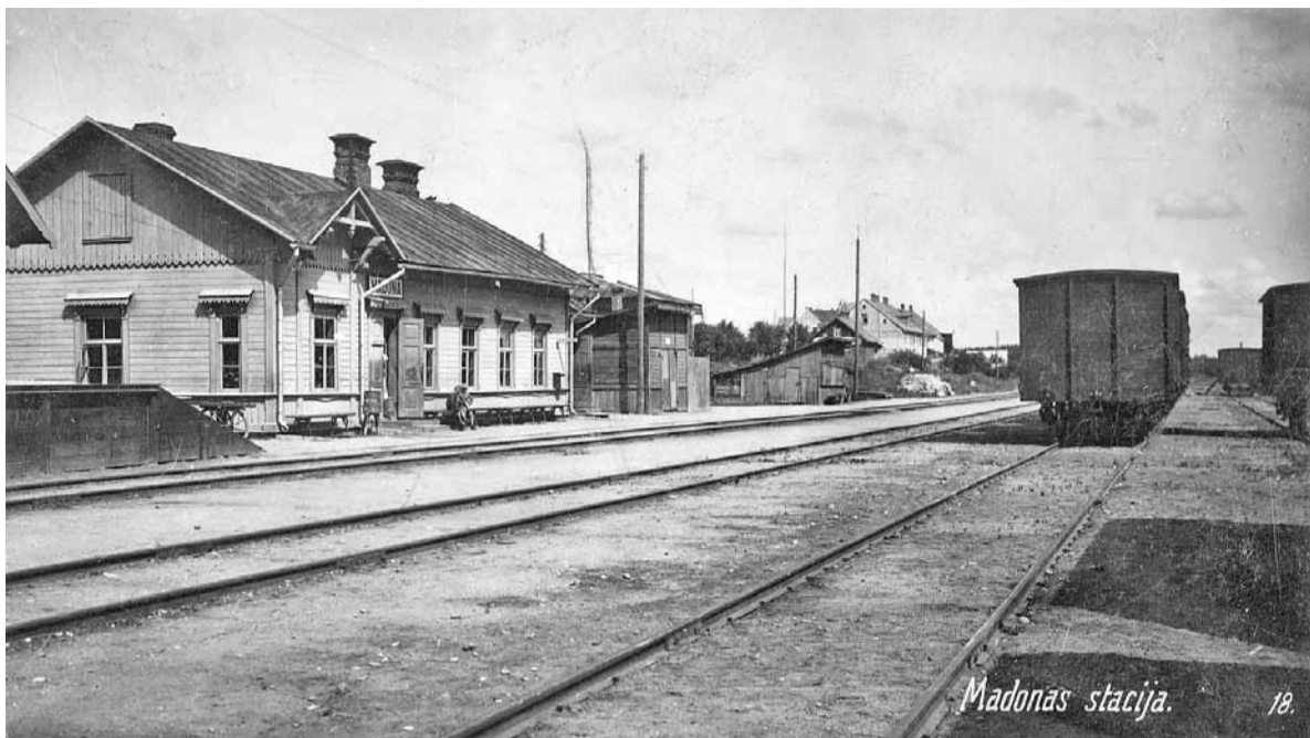
Madonas stacija 1929. gadā. Vēl nekas neliecina, ka daudziem no šejienes sāksies Golgāta ceļš uz Sibīriju un Tālajiem Austrumiem.

„...Daba taigā ir ļoti skaista. Pavasars turienes plāvās ziedēja puķes, ko Latvijā saimnieces stādīja savos puķu dārzos – ķeizarkroņi un dzeltenās lilijas. Bet ne jau par šo puķu