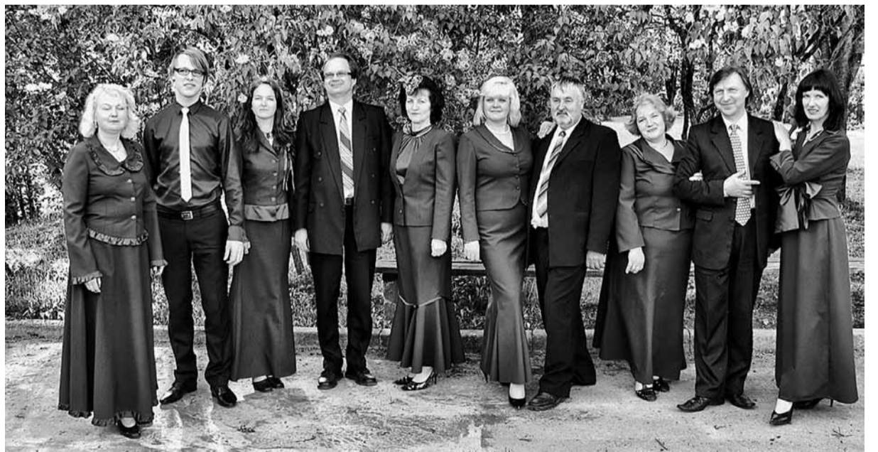
Jauktais vokālais ansamblis pēc konkursa fināla Vallē.

Svētku koncerta dalībnieks būs arī jauktais vokālais ansamblis, kam šī ir astotā darba sezona, un pavisam droši var teikt, ka pati veiksmīgākā. Skatē, kas notika martā un kurā piedalījās 9 muzikālie kolektīvi no Madonas novada un vīru vokālais ansamblis no Varakļāniem, Sarkanu pagasta jauktā vokālā ansambļa sniegums bija ļoti pārliecinošs, par ko liecināja gan skaļie skatītāju aplausi, gan žūrijas vērtējums. Otrais rezultāts skatē ar 42,6 punktiem un I pakāpes diploms. Tālākais ansambļa ceļš 9. aprīlī veda