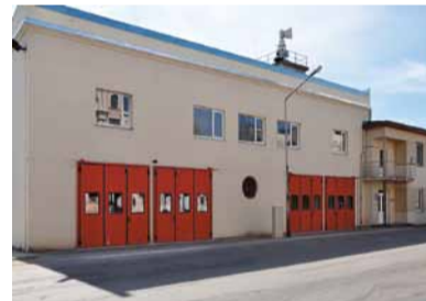
Rekonstruētā ēka un garāžas vārti pirms un pēc.