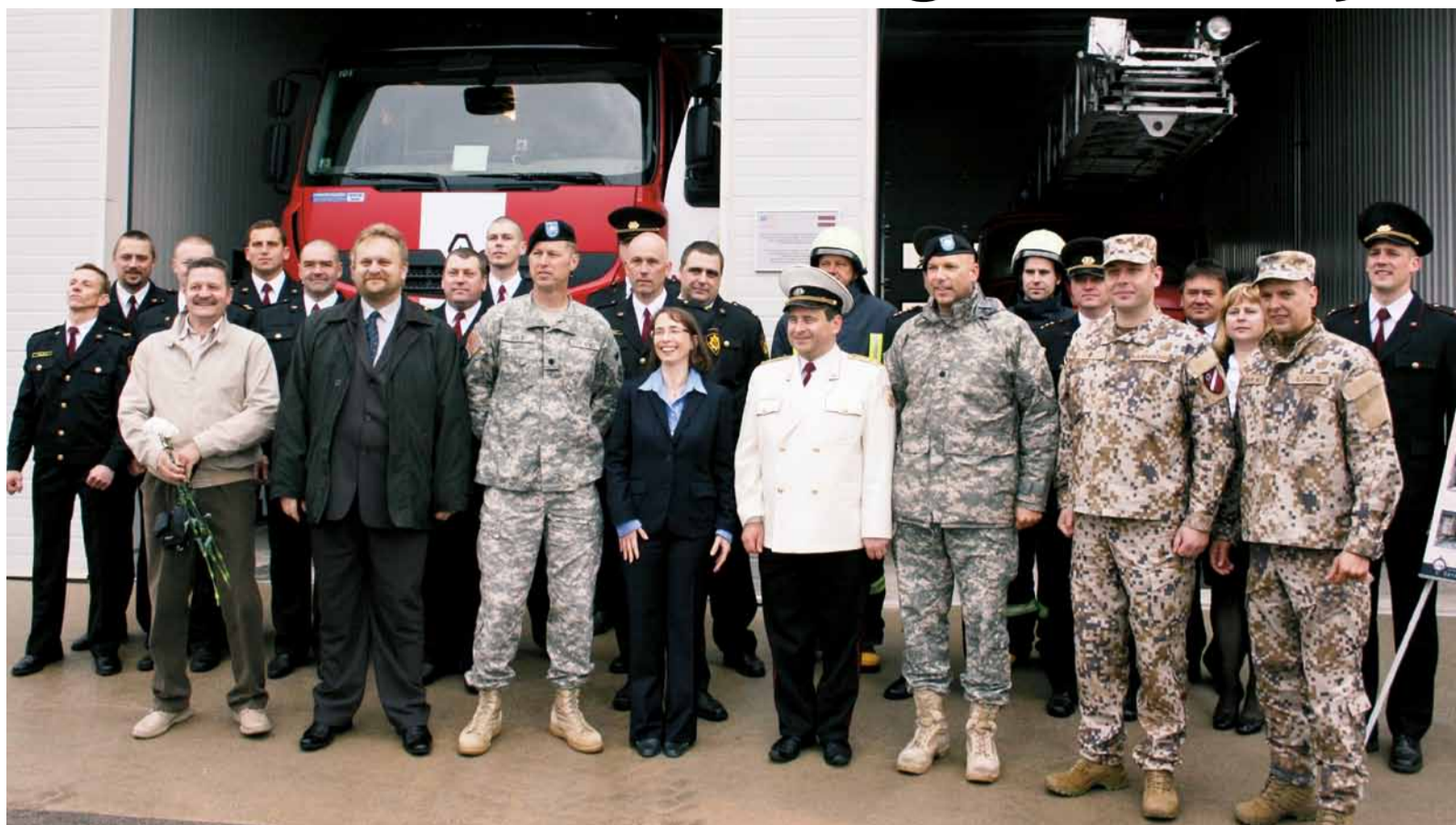
Vēstniece nofotografējās kopā ar novada domes priekšsēdētāju, ASV bruņoto spēku un Latvijas armijas pārstāvjiem, ugunsdzēsējiem.