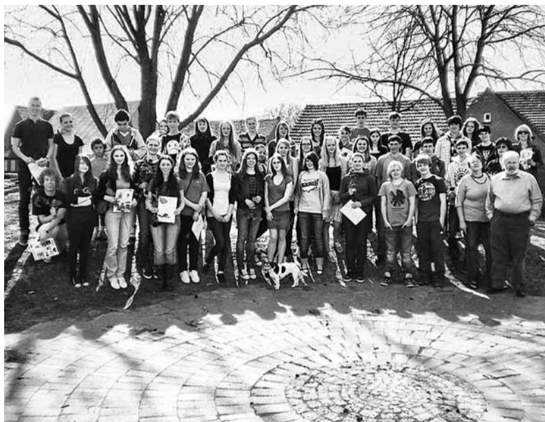
Madonas novada jaunieši Vaijē.

Atbildot uzrunai, pateicāmies par jauko uzņemšanu un paudām prieku par piedāvāto plašo programmu, kurā mums ļauts daudzveidīgi iepazīt vācu kultūru, vēsturi, ģeogrāfiju, izglītības sistēmu. Kā vislielāko ieguvumu uzsvērām – draudzības saīšu stiprināšanu starp latviešu un vācu jauniešiem. Šī draudzība, kas aizsākās Vaijē, ir vērsta uz nākotni,