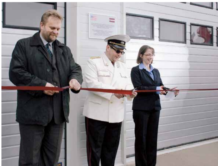
Rekonstruēto VUGD Madonas brigādes garāžu svinīga atklāšana.