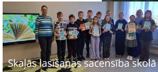
Skajā lasīšanas sacensība skolā