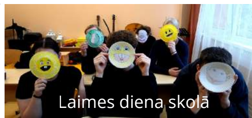
Laimes diena skolā