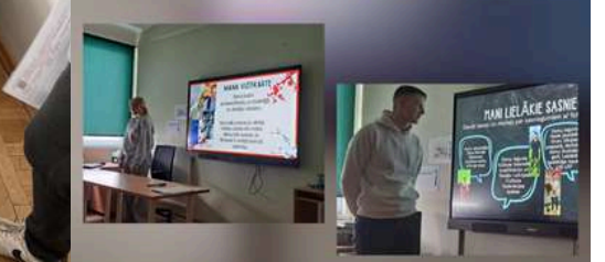
Devītie analizē sevi