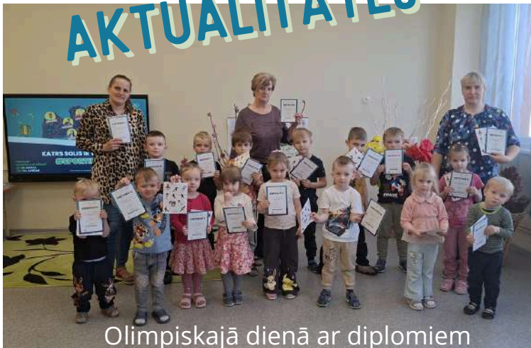
Olimpiskajā dienā ar diplomiem