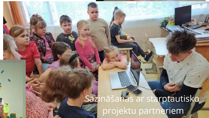
Sazināšanās ar starptautisko projektu partneriem