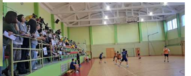
Starpskolu telpu futbols pie mums