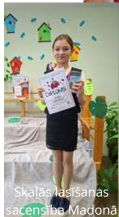
Skajā lasīšanas sacensība Madonā