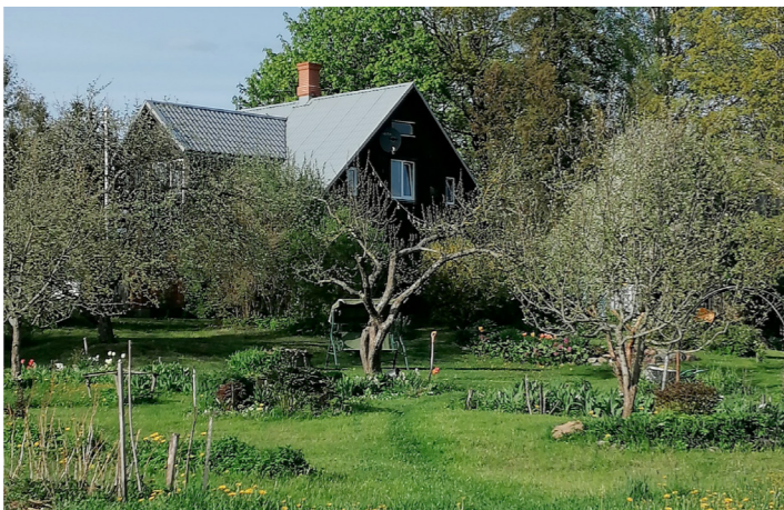
Mājas „Ezerkalni” šodien