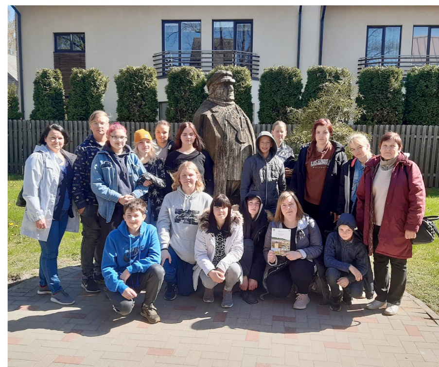
Pie Ādolfā Alunāna memoriālajā muzeja

Latviešu teātra tēva – aktiera, režisora un dramaturga – Ādolfā Alunāna memoriālajā muzejā bērni apskatīja tradicionālu 20. gs. sākuma dzīvokli. Klausoties aizrautīgajā un sirsnīgajā gides stāstījumā, uzzināja interesantākus faktus no teātra tēva biogrāfijas, centās ielāgot populārāko lugu un dziesmu nosaukumus, kā arī iepazīna atsevišķus tēlus. Nācās arī pašiem iejusties režisora un aktiera lomā. Skolēni izspēlēja dažādus jautrus notikumus „iz dzīves”, kurus Ādolfā Alunāns apkopojis „Zobgala