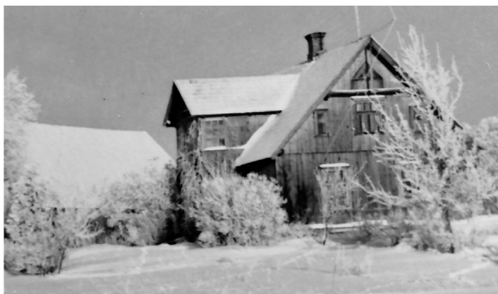
Mājas „Ezerkalni” agrāk

Mums ģimenei ir izveidoti divi dzimtas koki – gan vectēva, gan vecmammas. Dzimtas sakņu pētīšanu sāka