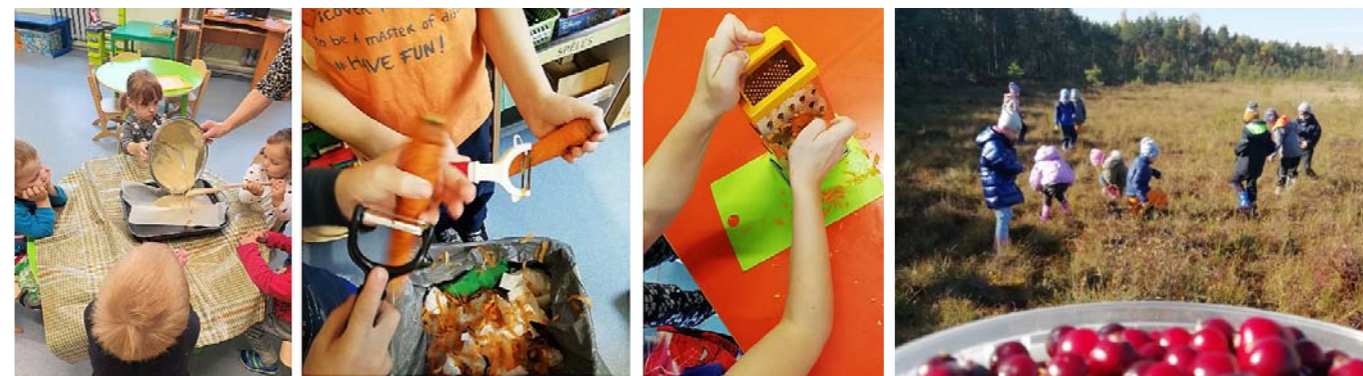
Ciemojamies mežā un purvā. Baudam un priecājamies par sātajām dzērvenēm.