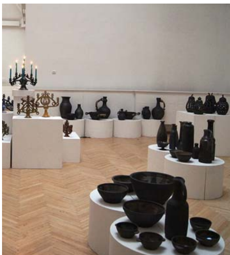
Jāņa Seiksta darbi.