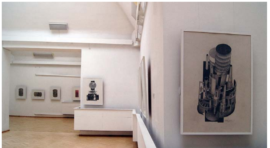
Gunāra Kroļļa grafika.