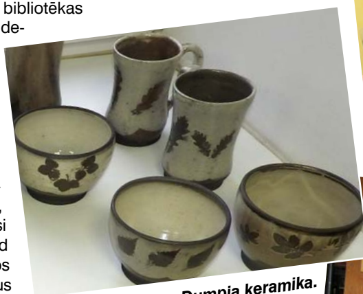
Eināra Dumpja keramika.

Izstādes apmeklētāji varēja iegādāties skaistas dāvanaņas sev un saviem mīļajiem.