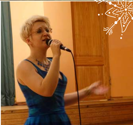
Dzied Ginta Gerševica no Lubānas.