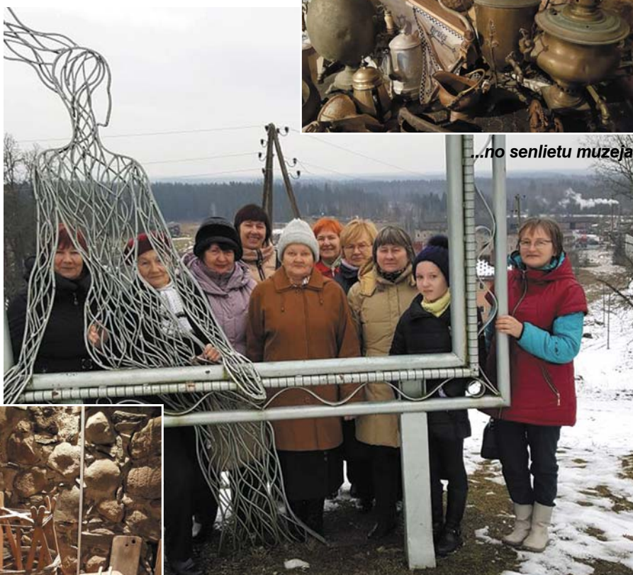
Skatu kalnā pie Biksēres muižas.