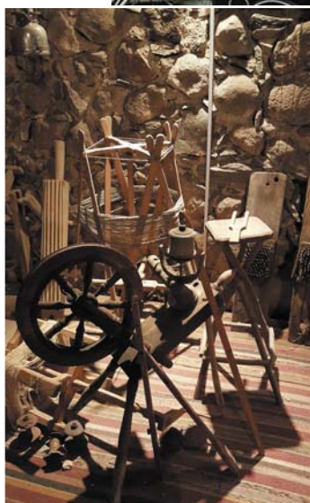
Senie vilnas un lina dziju sagatavošanas un apstrādāšanas darbarīki.