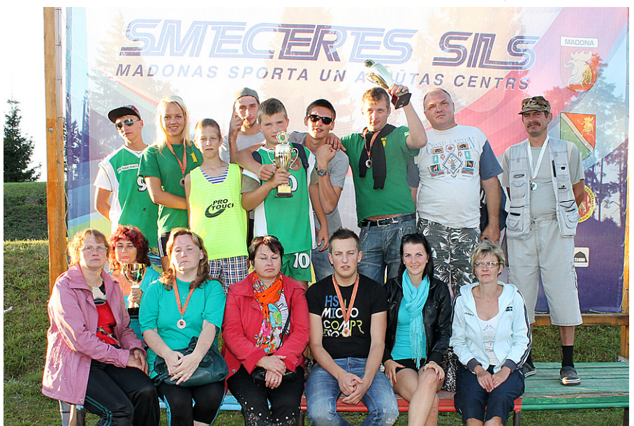
Mētrienas saliedētā komanda.