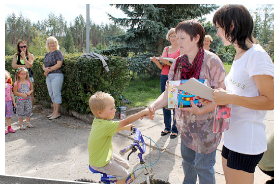
Balvu saņem Edijs.