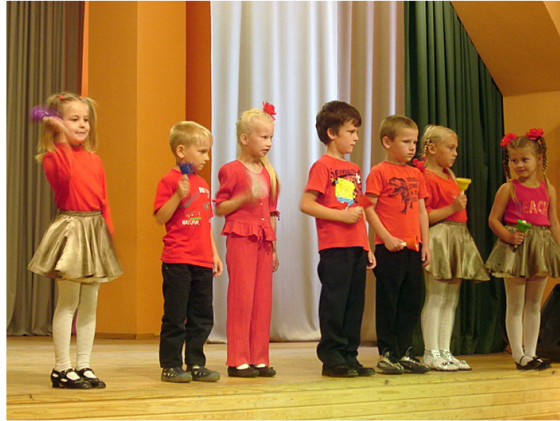
Uzstājas Mētrienas pirmsskolas grupa.