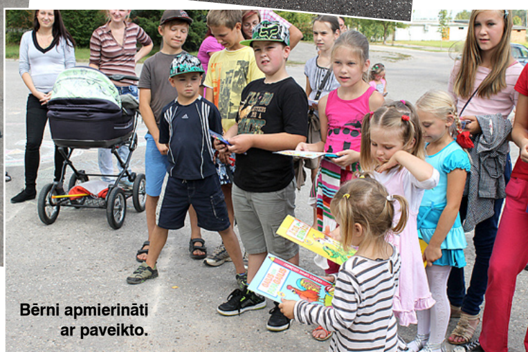
Bērni apmierināti ar paveikto.