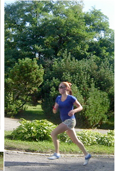
Skrējieni Apkār Mētrienai.