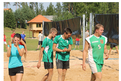
Mētrienas volejbolisti laukumā.