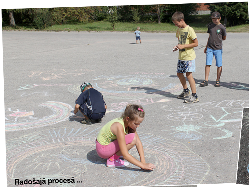
Radošajā procesā ...