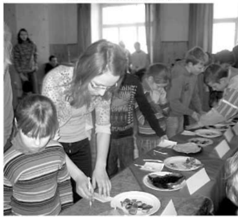
Pankūku vērtētāji ir aktīvi.

„Mīlestības pietura” kalpoja kā dekorācija galvenokārt foto sesijām.