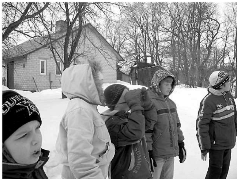
Kamēr vēl piesalst (18.03.), 5. klase devusies ziemas putnu vērošanā.