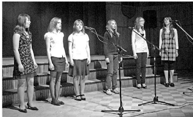
Dejo „Resgaļi” meitenes, dziesmas skandē Sarkaņu pamatskolas 7.-9. klašu vokālais ansamblis.