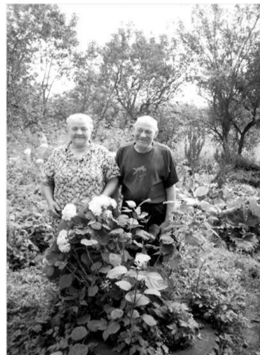
2007. gada vasarā.