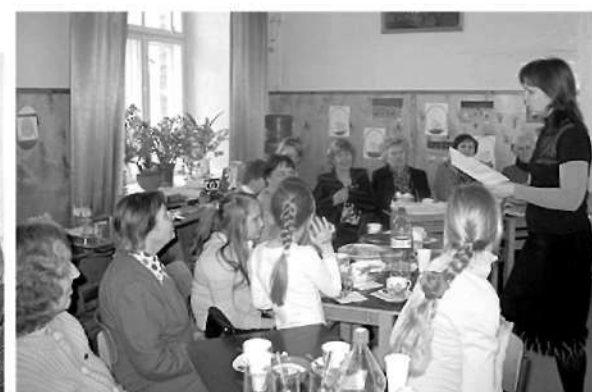
Atjautības uzdevumi risināmi kopā ar mazbērniem.