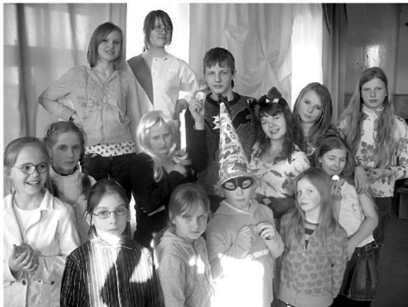
Karnevāla dalībnieki priecīgi par jautri pavadīto laiku.