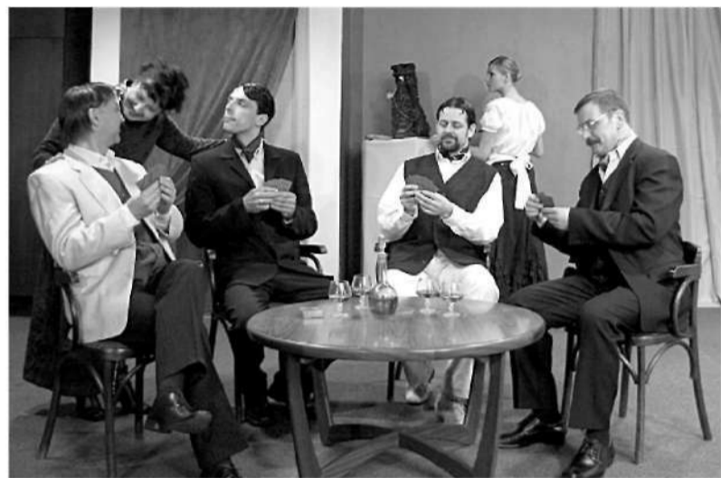
„Piņģerota” aktieri skates laikā.