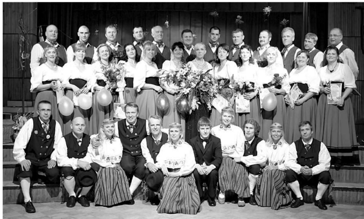
1. rindā deju kolektīvs "Hopsani"

Valdas Kļaviņas teksts