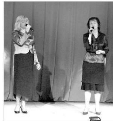
Duets Dace un Sarmīte.

25. aprīlī deju kolektīvu skatē piedalījās pagasta deju kolektīvi. Deju kolektīvs „Senči” ieguva I pakāpes diplomu, jauniešu deju kolektīvs „Resgaļi” – II pakāpes diplomu. II pakāpes diplomu saņēma arī deju kolektīvs „Labākie gadi”, kas pārstāvēs Madonas novadu VII Vislatvijas vidējās paaudzes deju kolektīvu svētkos 5. jūnijā Valmierā un skatē viņiem bija jāpiedalās ar deju no šo svētku obligātā repertuāra.