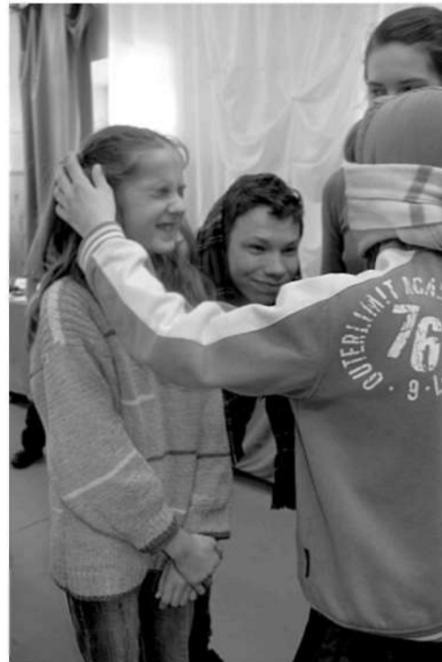
Zēni aizsietām acīm nosaka „objektu”.

Laura Šcedrova, skolēnu līdzpārvaldes vadītāja