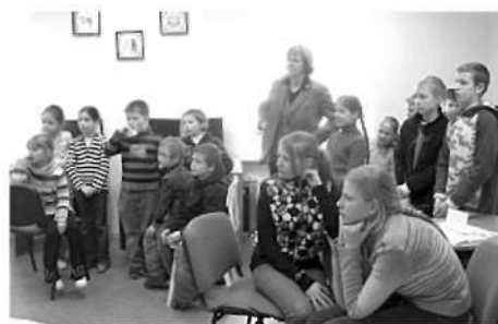
Labi lasītāji var būt arī vērtīgi klausītāji.