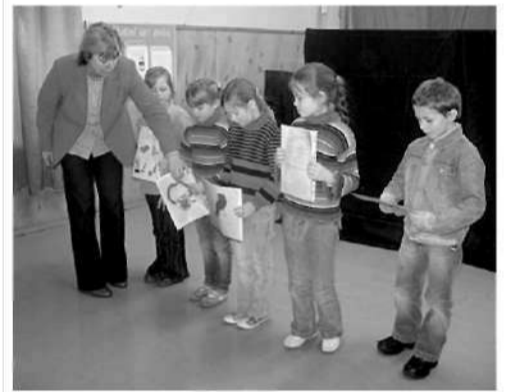
Par savu projektu stāsta 2. klase.

No Vitas Jansones sagatavotās lappuses „Skurstenim”