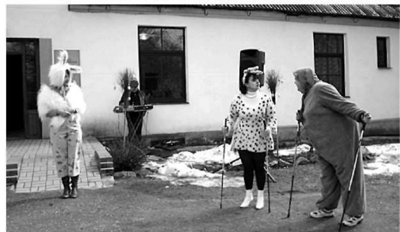
Pičs (V. Kļaviņa) sagaidījis ciemiņus – zaķi Žani (I. Bārbale) un Zuzi (A. Auzāne).

Valdas Kļaviņas teksts, Inetas Simtnieces, Aigara Krīģerta, Imantas Simtnieces un Iizes Drozdovas foto