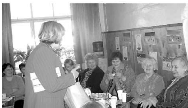
Atkalsatikšanās prieks vecvecāku pēcpusdienā.

Mārīte Lukašuna, skolotāja Ineses Sudāres foto