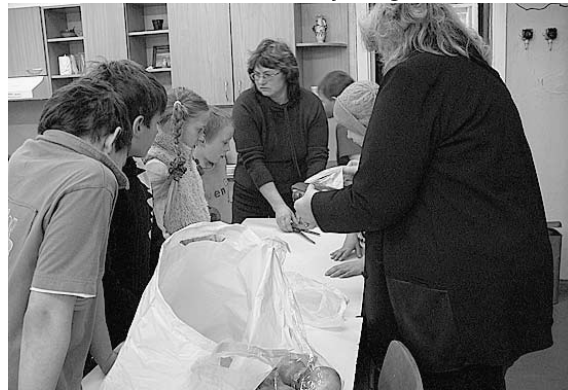
3. – 4. klašu skolēni mācījās vārīt miežu biezputru.