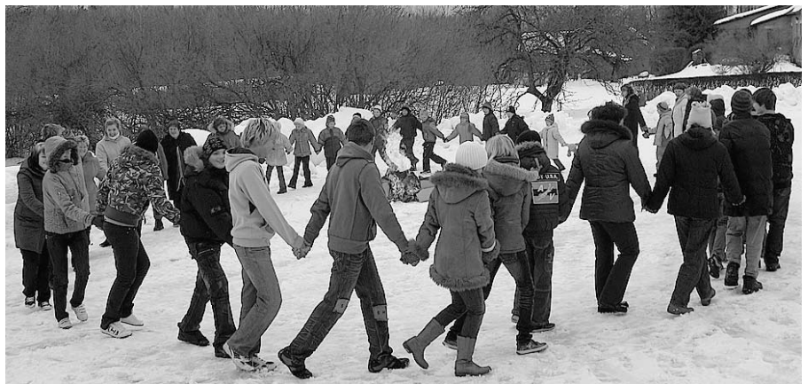
Roku rokā ap uguns kuru.