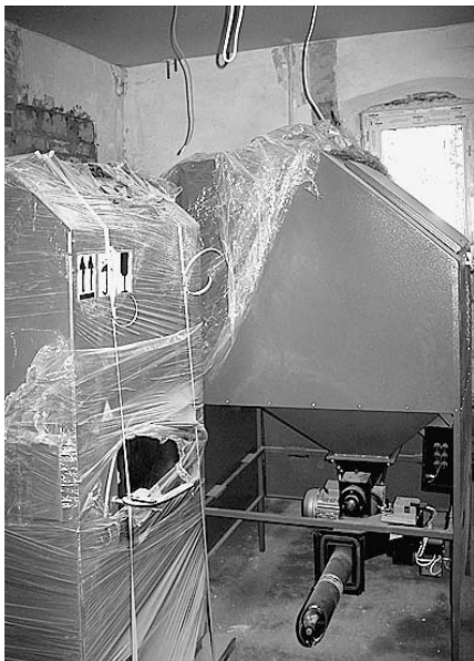
Jaunie apkures katli.