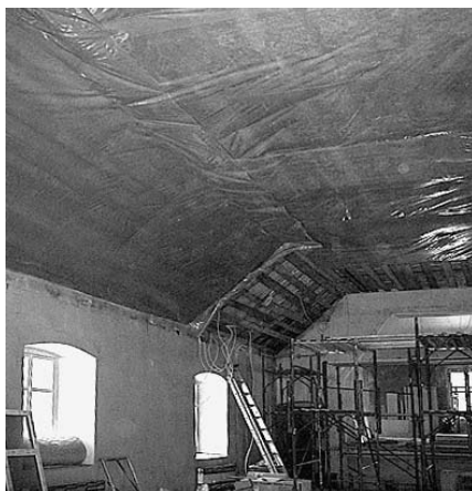
Tiek veikts rūpīgs darbs pie zāles griestiem.