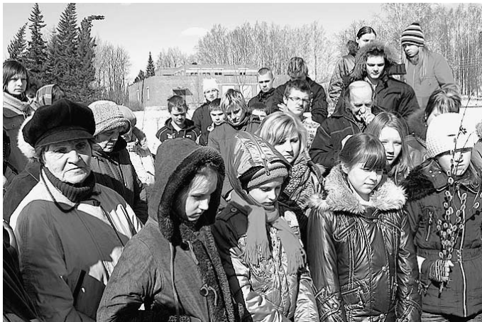
Piemiņas brīdis bija patiesa vēstures stunda skolēniem.