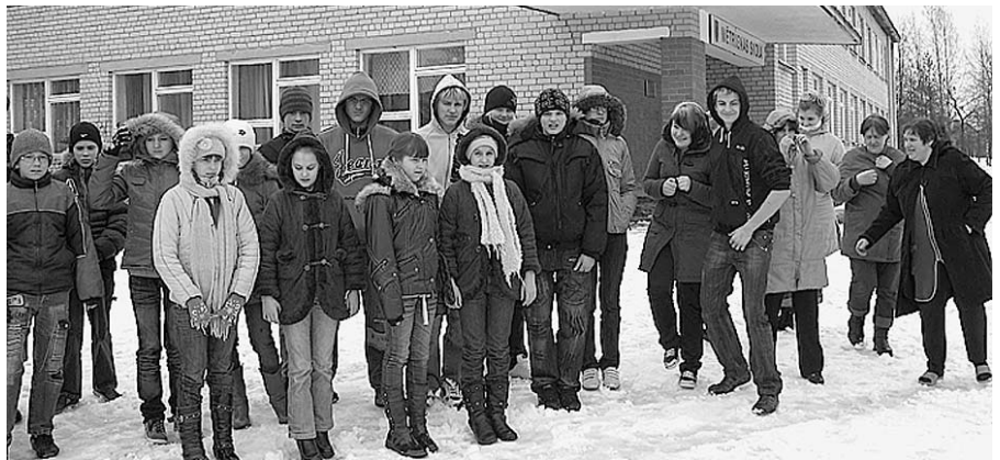
Mēs gribam mācīties savā skolā...