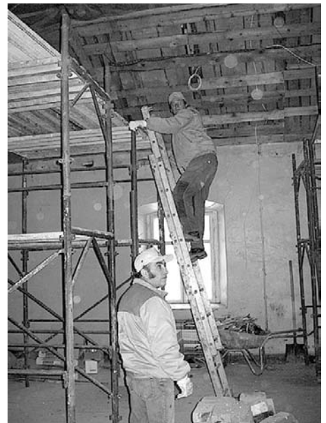
Strādnieki strāa rūpīgi un čakli.