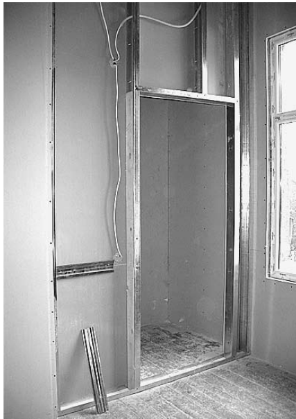
Uz skatuves top ērta tērpu noliktava.