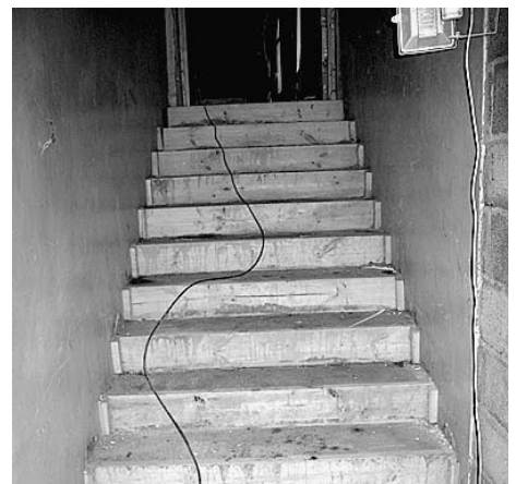
Nomainītas kāpnes uz zāli.