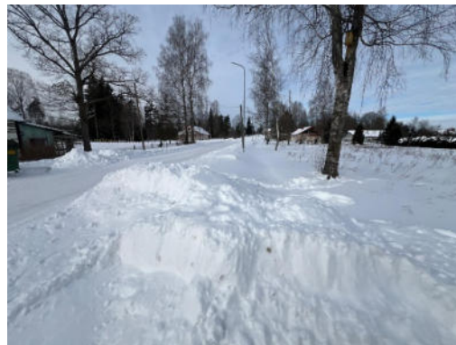
1.,2.attēls. Zemes vienība