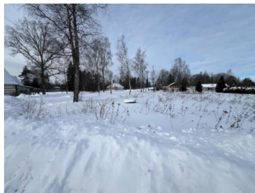
7.,8.attēls. Zemes vienība