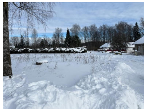
3.,4.attēls. Zemes vienība