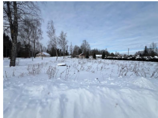
5.,6.attēls. Zemes vienība