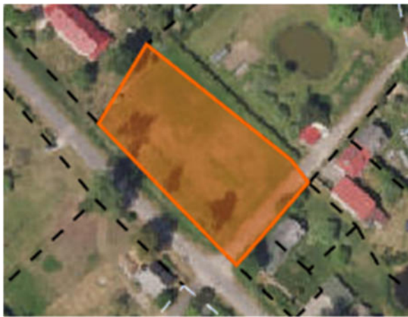
Avots: LAD, LGIA, VZD, OSM, Sentinel-2 (2026). Lauku bloku karte https://karte.lad.gov.lv/?q=70740040384 , sk. 10.03.2026.