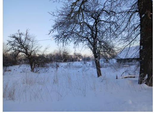
2.attēls. Zemes vienība