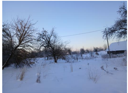
3.,4.attēls. Zemes vienība