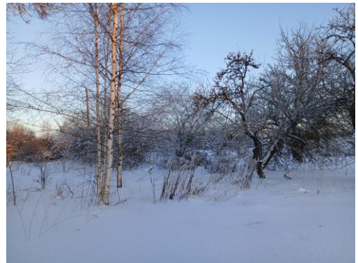
5., 6.attēls. Zemes vienība