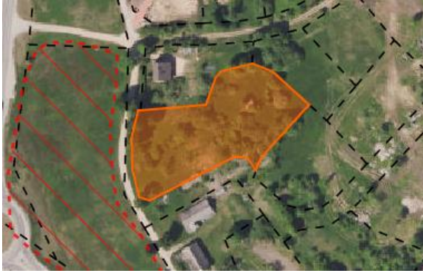
1.attēls. Zemes vienība k.apz. 70010012203 (avots: https://karte.lad.gov.lv/ )