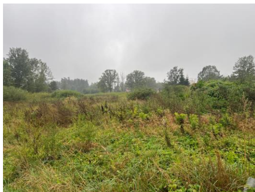
1.attēls. Zemes vienība