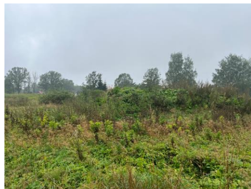
2.attēls. Zemes vienība