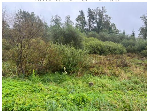
3.,4.attēls. Zemes vienība