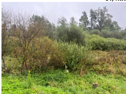
5.,6.attēls. Zemes vienība