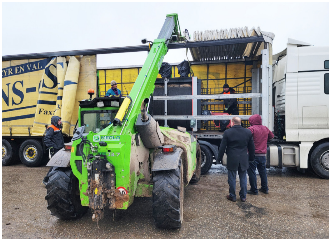
Gāzes apkures katls, ievietots kravas furgonā, devies ceļā pie Bobrinecas iedzīvotājiem.

Vienlaikus pašvaldība saņēma Ukrainas Kirovogradsk apga-