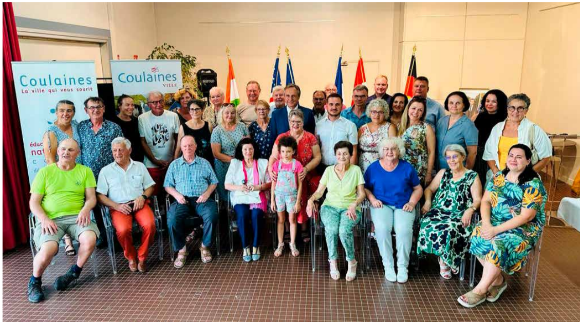
Madonas delegācija kopā ar Kulēnas sadraudzības partneriem.

Tikmēr daļa Madonas delegācijas apmeklēja skolu, iepa-