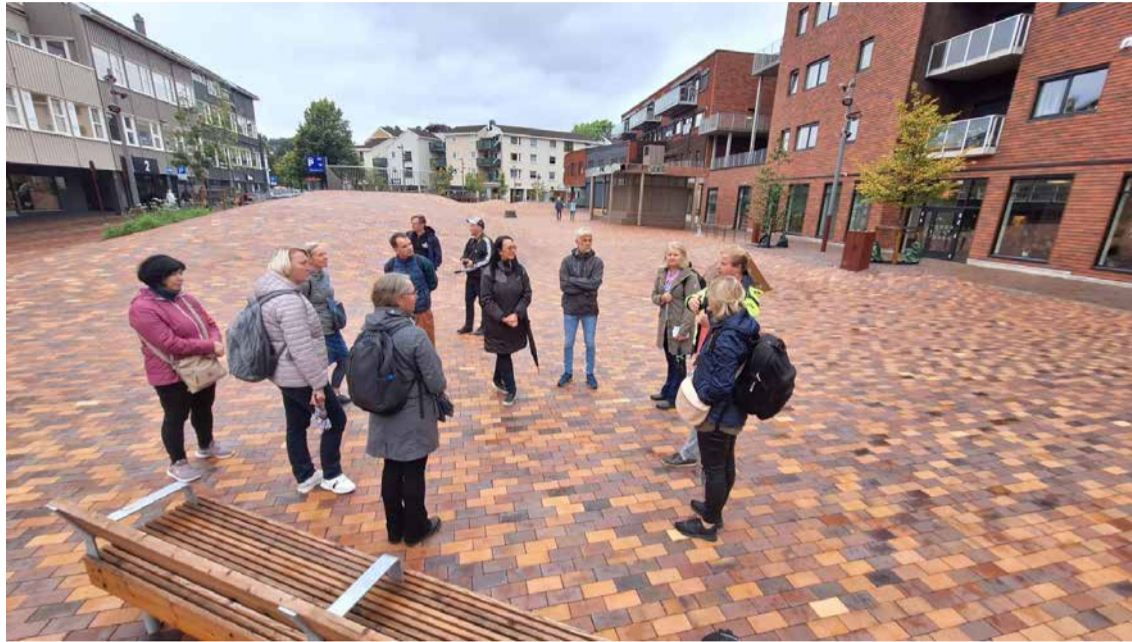
Madonas novada delegācija.

Sandefjordas pašvaldībā tika plaši pārrunātas tēmas, kas saistītas ar teritorijas un attīstības plānošanu, sabiedrības līdzdalību plānošanas procesā un iesaisti lēmumu pieņemšanas procesos, kā arī pašvaldības struktūru darbību. Vēsturiski Sandefjorda ir veidojusies kā vaļu medniecības centrs. Arī reģiona attīstība lielākoties tika balstīta uz šo industriju. 2017. gadā administratīvi teritoriālās reformas procesā Sandefjordai pievienojās divas citas pašvaldības – Andebu un Stokke. Kopējais pašvaldības iedzīvotāju skaits šobrīd ir nepilni 65 000 iedzīvotāju ar nelielu pieauguma tendenci. Sarunās pašvaldības pārstāvji neslēpa, ka reformas sekas joprojām ir izjūtamas, jo apvienotās teritorijas Sandefjordu kā jauno centru līdz galam nav pieņēmušas, taču šī nosacītā “lokālpatriotisma” sekas ar katru gadu mazinās, jo pašvaldības apzinās, ka kopā var izdarīt vairāk un pakalpojumu klāsts, ko saņem komūnas iedzi-