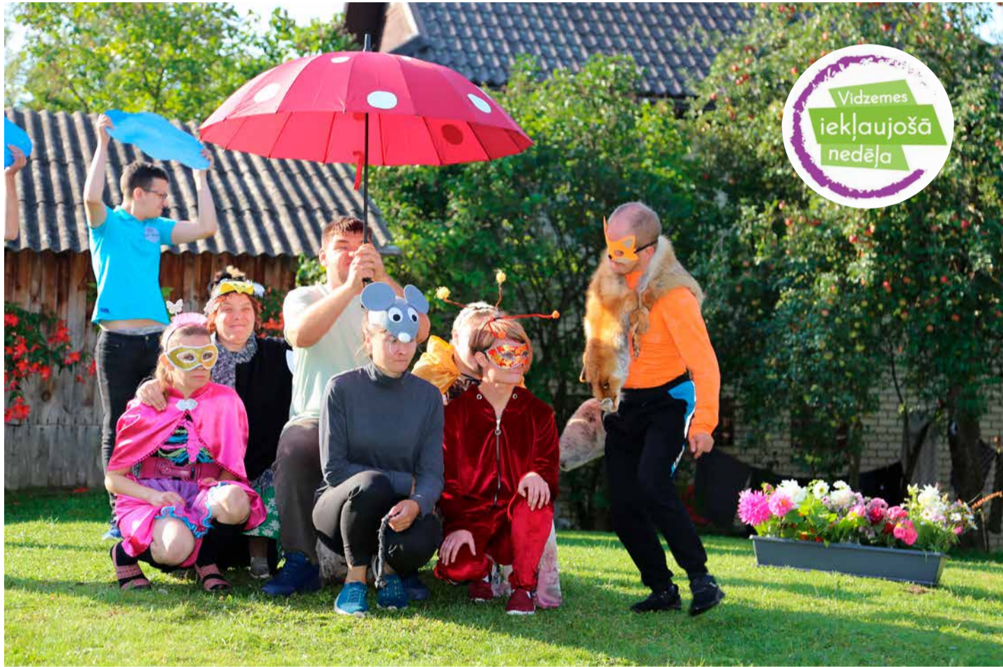
Dienas centra jaunieši pārsteidza ar savām aktiermeistarības prasmēm un aizkustināja skatītājus.

Aicinājums mazliet vairāk izprast sabiedrībā balstītu sociālo pakalpojumu ikdienu