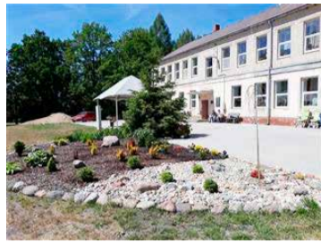
Apstiprina projekta "Ener-

goefektivitātes uzlabošanas pasākumi "Kastaņās", Sausnējas pagasts, Madonas novads" izmaksas 665 025,60 eiro apmērā.