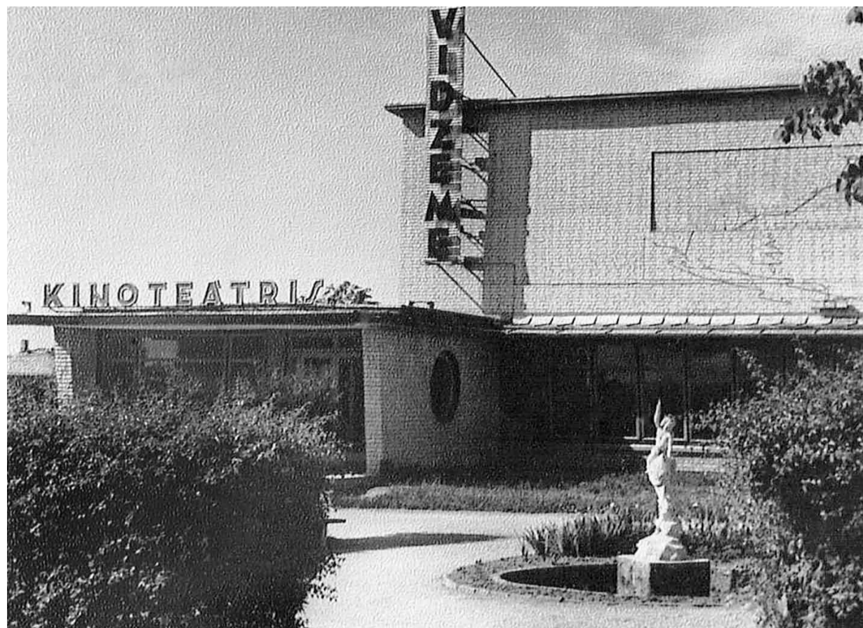
Kinoteātra “Vidzeme” pirmsākumi 1962. gadā.

6. novembrī apritēs 55 gadi, kopš Madonā darbojas kinoteātris “Vidzeme”, dodot iespēju madoniešiem un Madonas viesiem baudīt kino kultūru un būt pilntiesīgiem kino industrijas dalībniekiem.