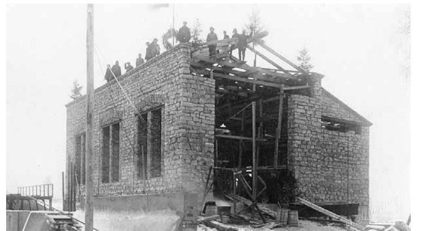
Spāru svētki spēkstacijas ēkai, 1931. g. rudenī.