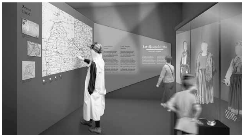
Topošās izstādes mākslinieciskā risinājuma skice. Autors: dizaina birojs H2E.

Izstādē ir īpaša ar to, ka tajā vienkopus būs apskatāmas izcilākās Latvijas muzeju vērtības no visiem novadiem par valsts pa-