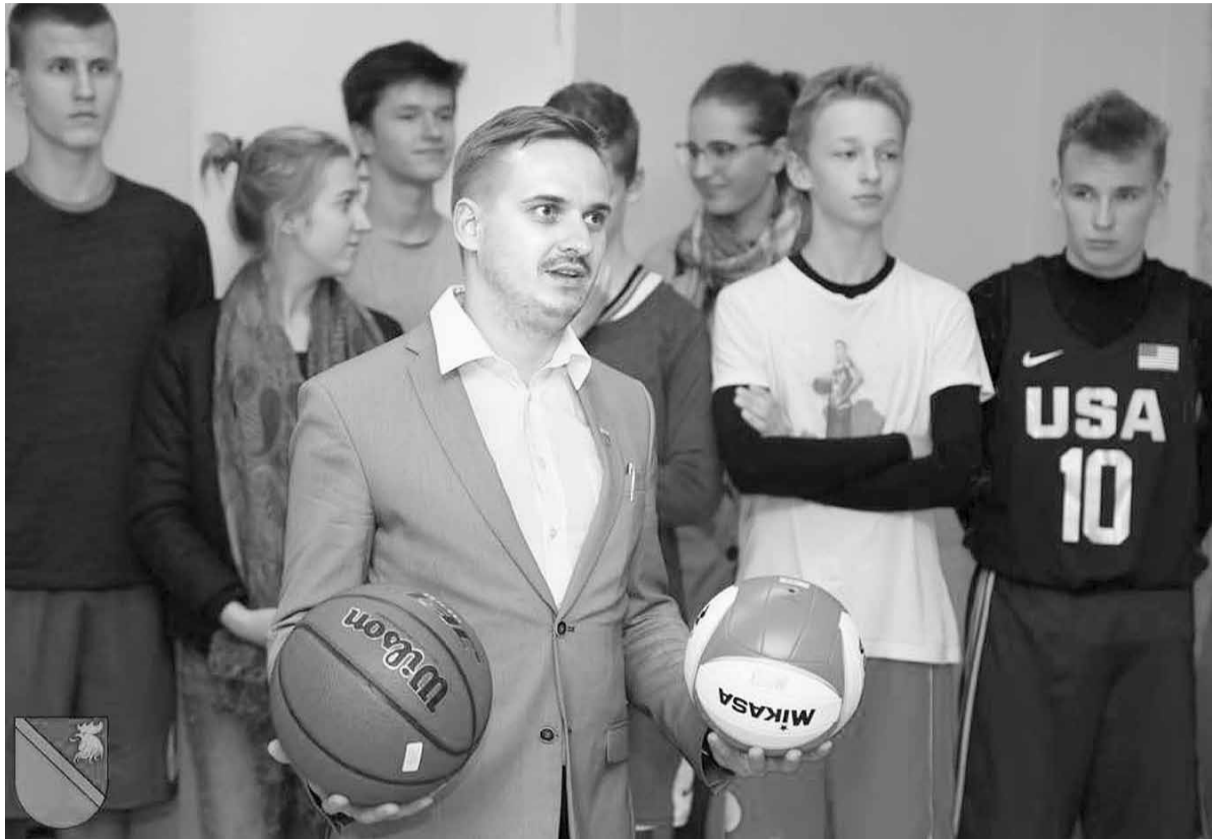
Atklājot Barkavas pamatskolas sporta zāli šī gada 5. oktobrī.

Atgriežoties pie paveiktajiem darbiem – daudz paveikts arī sociālajā jomā. Nesen Dzelzavas pansionātā sākām piedāvāt pakalpojumu „Sociālā gulta”, un jau šobrīd redzam, ka visas gultas ir aizpildītas. Skaidrs, ka mīnēto pakalpojumu nepieciešams paplašināt. Pamazām notiek siltināšanas darbi ēkai Madonā,