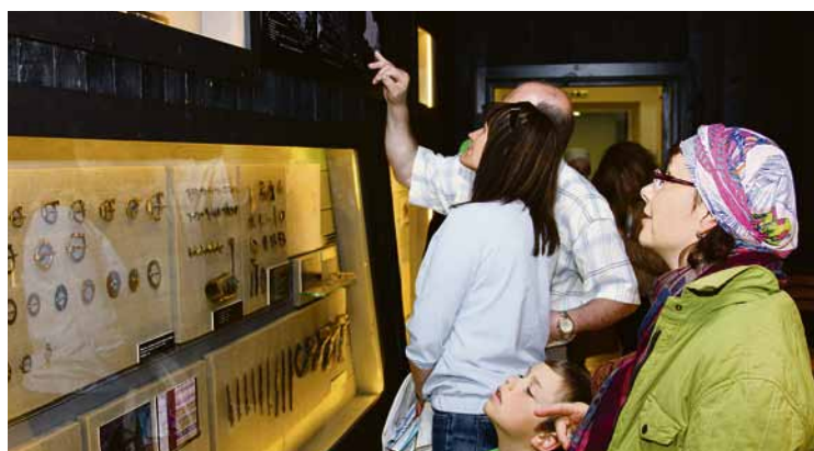
Pēc rekonstrukcijas atvērta arī novada arheoloģijas ekspozīcija, kas atdzimusi gluži jaunā veidolā.