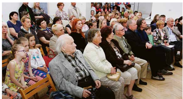
Kopumā aizvadītā Muzeju nakts Madonā pulcēja daudz lielu un mazu apmeklētāju, muzeja ļaudis lēš, ka interesentu bijis vairāk nekā pusotra tūkstoša.