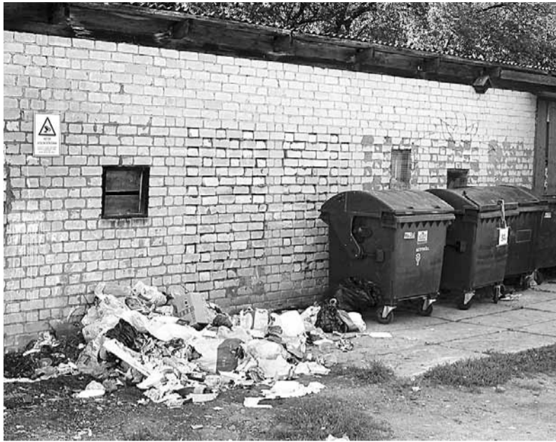
Aina, kas paveras pie Saules ielas 38 koplietošanas sadzīves atkritumu laukuma.

Atkritumi mesti ne tikai konteineros, bet arī zemē, piesārņojot vidi un radot nepatīkamas smakas. Tāpat, par šo lielo atkritumu daudzumu jāmaksā laukumam piesaistītā daudzdzīvokļu nama iedzīvotājiem. Izpild-direktors atgādina, ka būtiski ir sa-