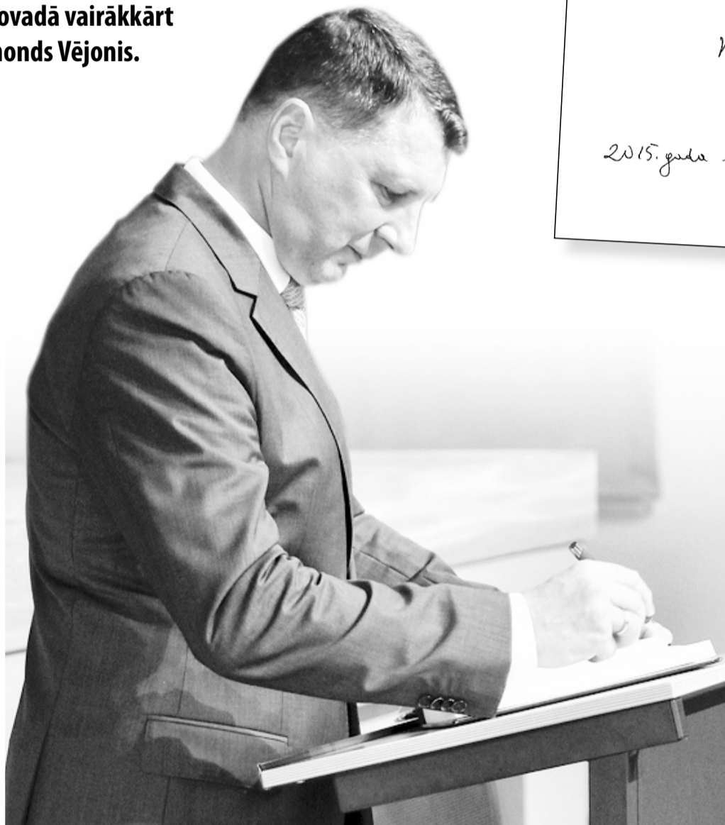
Valsts prezidents Raimonds Vējonis izdara pirmo ierakstu Madonas novada pašvaldības goda viesu grāmatā.

Esmu lepus būt madonietis! Madona ir pilsēta, kas attīstās, spēko, veido ģimenes, audzina bērņus. Madone ir Latvijas izcītību kalve. Turpiniet tādi būt un novēlu vēl daudzām attīstību!