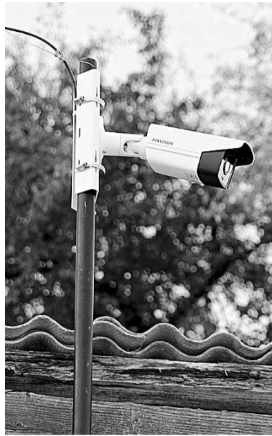
Uzstādītā novērošanas kamera fiksē visu, kas notiek Saules ielas 38 atkritumu laukumā.