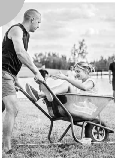
Aizraujošajās disciplīnās piedalījās kā lieli, tā mazi komandu dalībnieki.