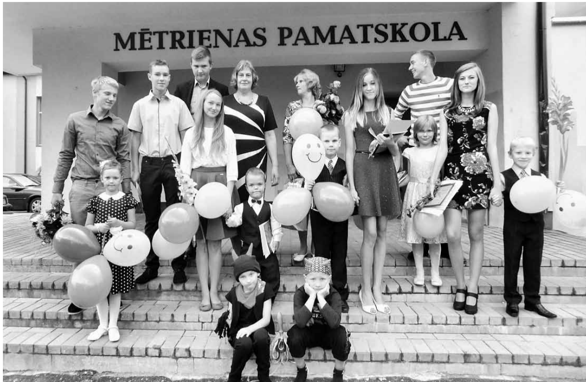
Mirkļis no 1. septembra Mētrienas pamatskolā. 9. klases skolēni un 1. klase ar velniņiem un audzinātājām.

Direktore pauž pateicību vecākiem, kas tic pagasta skolai un