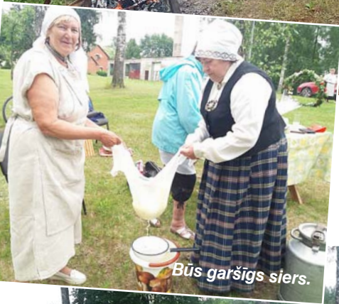
Būs garšīgs siers.