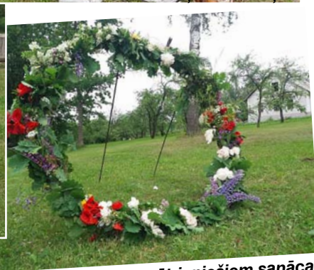
Tāds nu mētrieniešiem sanāca.