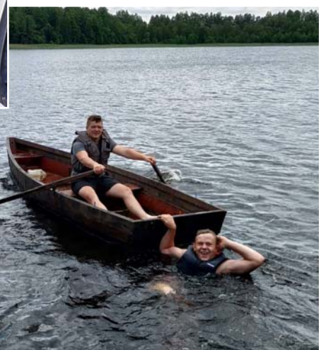
Ekstrēms uzdevums – brauciens ar laivu.