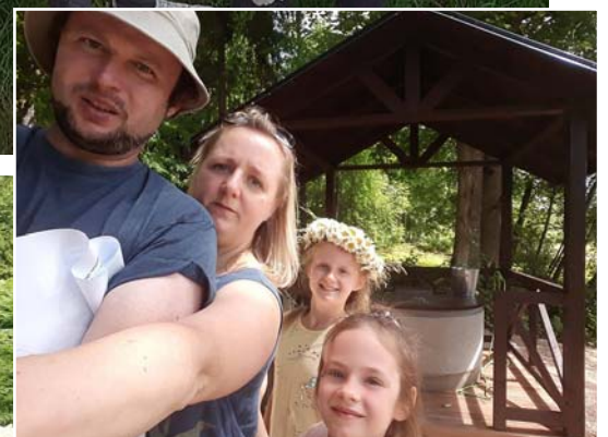
Aktīvi darbojas Macijevsku ģimene.