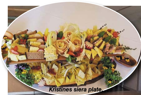
Kristīnes siera plate.