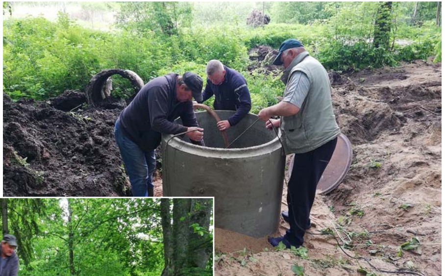
Darbs pie avotiņa sakārtošanas.

Laura Biķerniece