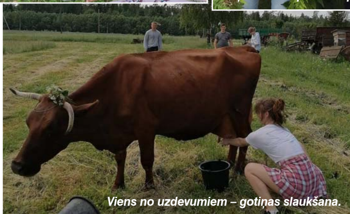
Viens no uzdevumiem – gotiņas slaukšana.