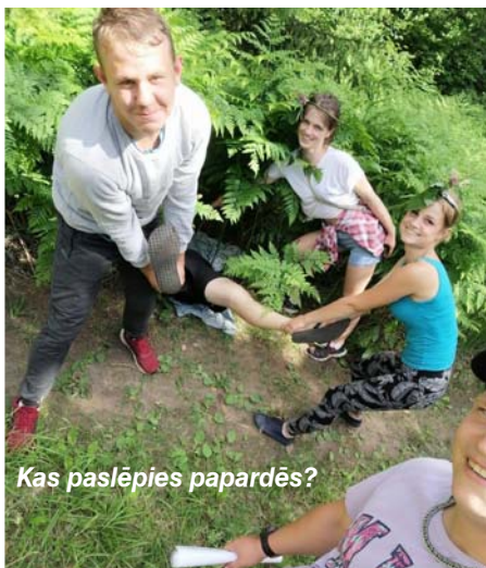
Kas paslēpies papardēs?