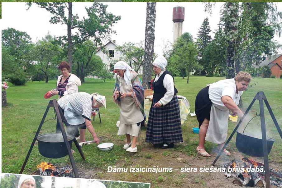
Dāmu izaicinājums – siera siešana brīvā dabā.