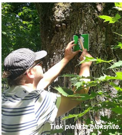
Tiek pienākta plaksnīte.