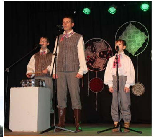
Viens no vaļaspriekiem.