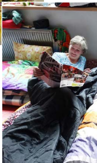
Lolita Dziesmu un deju svētku laikā.

Solvita Stulpiņa Foto no SDK „Mētra” personīgā arhīva