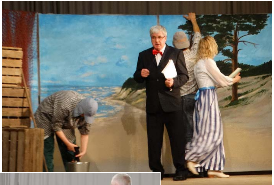
Izrādē NEVEIKSMINIEKA VEIKSMĒ.