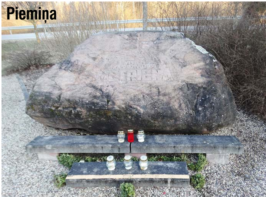
Piemiņas akmens šogad 25. martā skuma vientuļš.