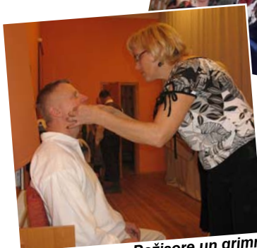
Režisore un grimētāja vienā ampluā.