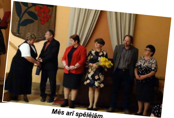
Mēs arī spēlējām.