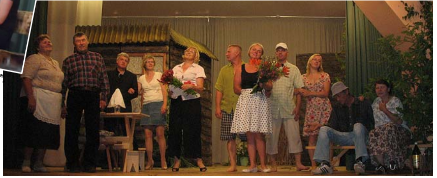
„Sunītis un kauliņš” 2013.