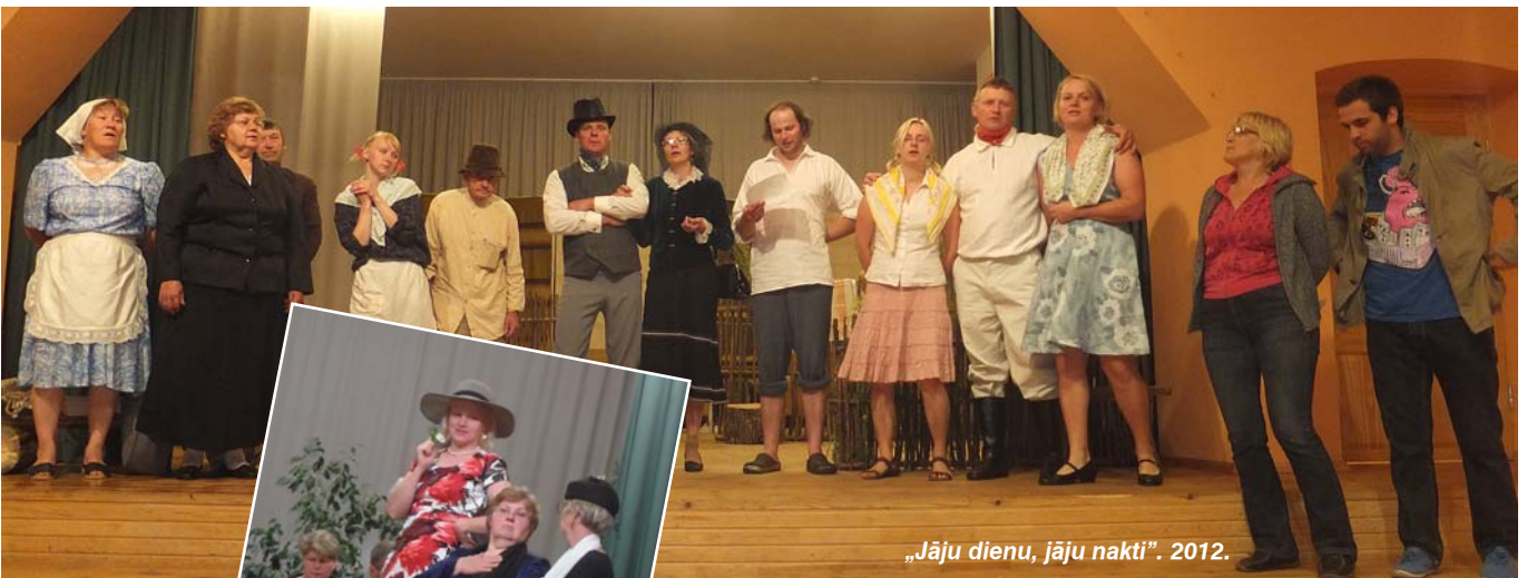
„Jāju dienu, jāju nakti”. 2012.