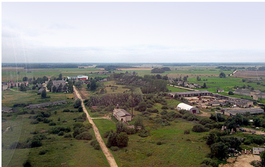
Skats no augšas.