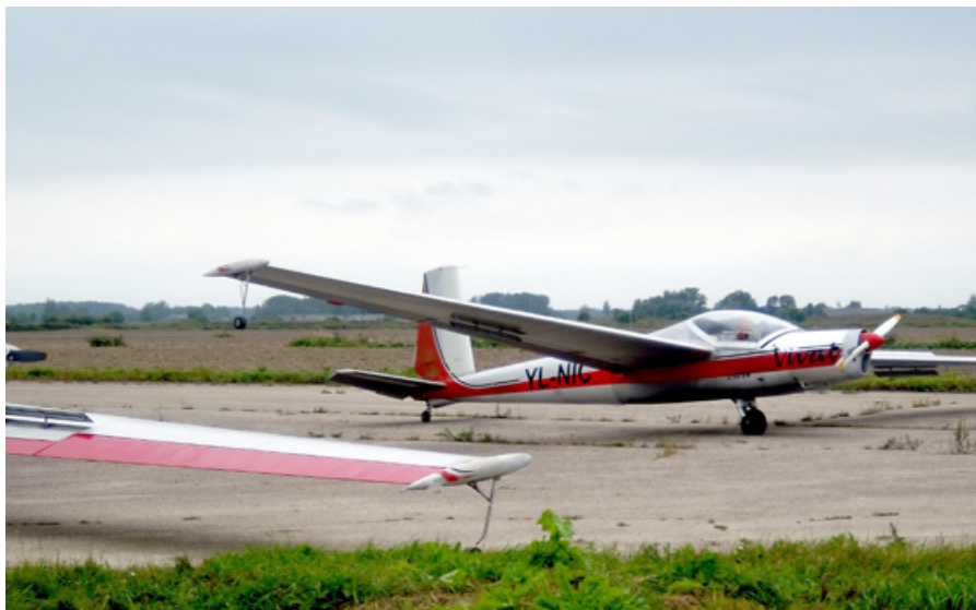
Šī lidmašīna izvizināja visus bezbailīgos.